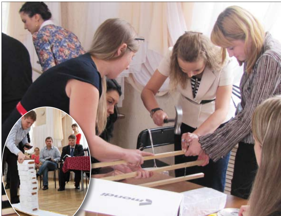
Девушки из центральной лаборатории колдуют над будущим мостом.

финал вышла девичья команда из центральной лаборатории. Справятся ли девочки с такой работой? Вопрос не праздный. Но сомнения рассеялись, когда все увидели, как уверенно работают красавицы-молотком.