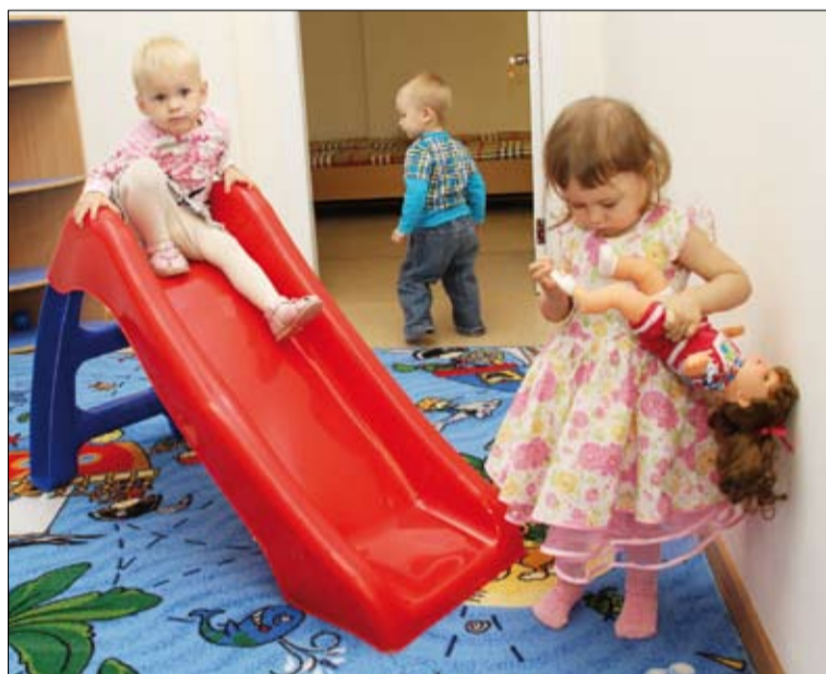
Новые хозяева изучают игровую комнату.