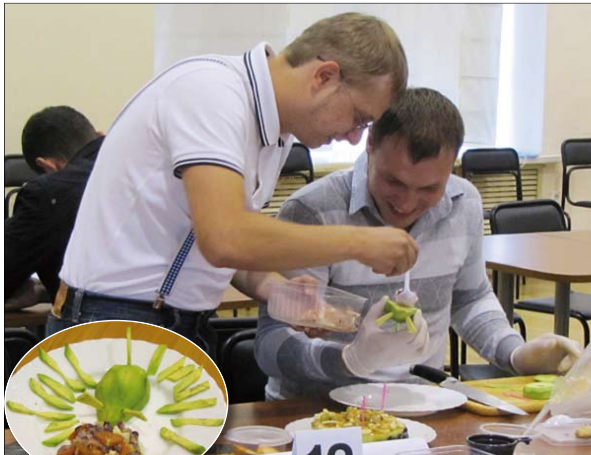
Над салатом «Мышь в траве» трудятся юноши из цеха электролиза меди.