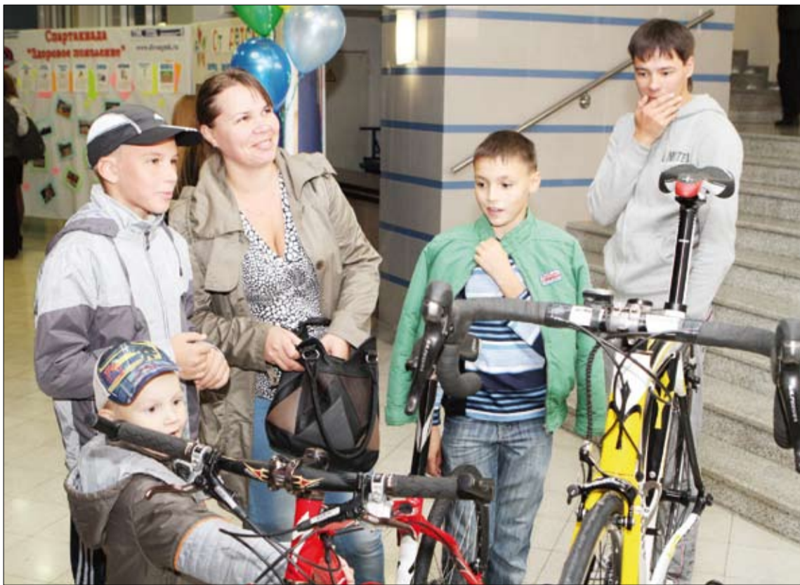
На ярмарке секций интересно и детям, и взрослым.