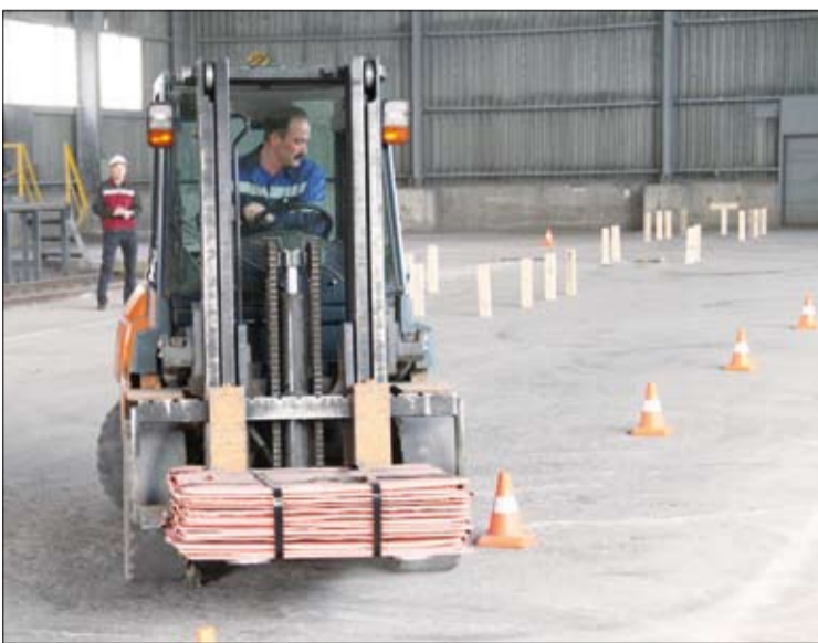
Управлять весом десять тонн — дело привычное для водителей погрузчиков ЖДЦ.