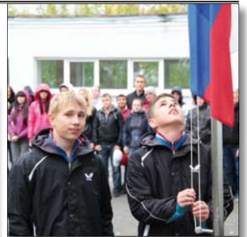
Будущее российского спорта: им ещё учиться и учиться!

Там, кстати, вчера стартовал учебный год – 97 воспитанников из разных уголков страны сели за парты. Среди них – победители и призёры чемпионатов и первенств России, Европы и мира, первенств и чемпионатов УрФО. Здесь готовят профессиональных спортсменов по настольному теннису, борь-