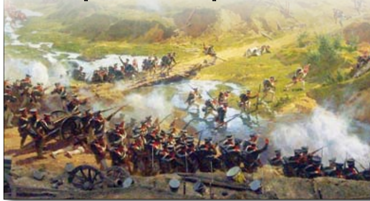
Атака русской пехоты.

городах для защиты от населения, начавшего борьбу с французами.