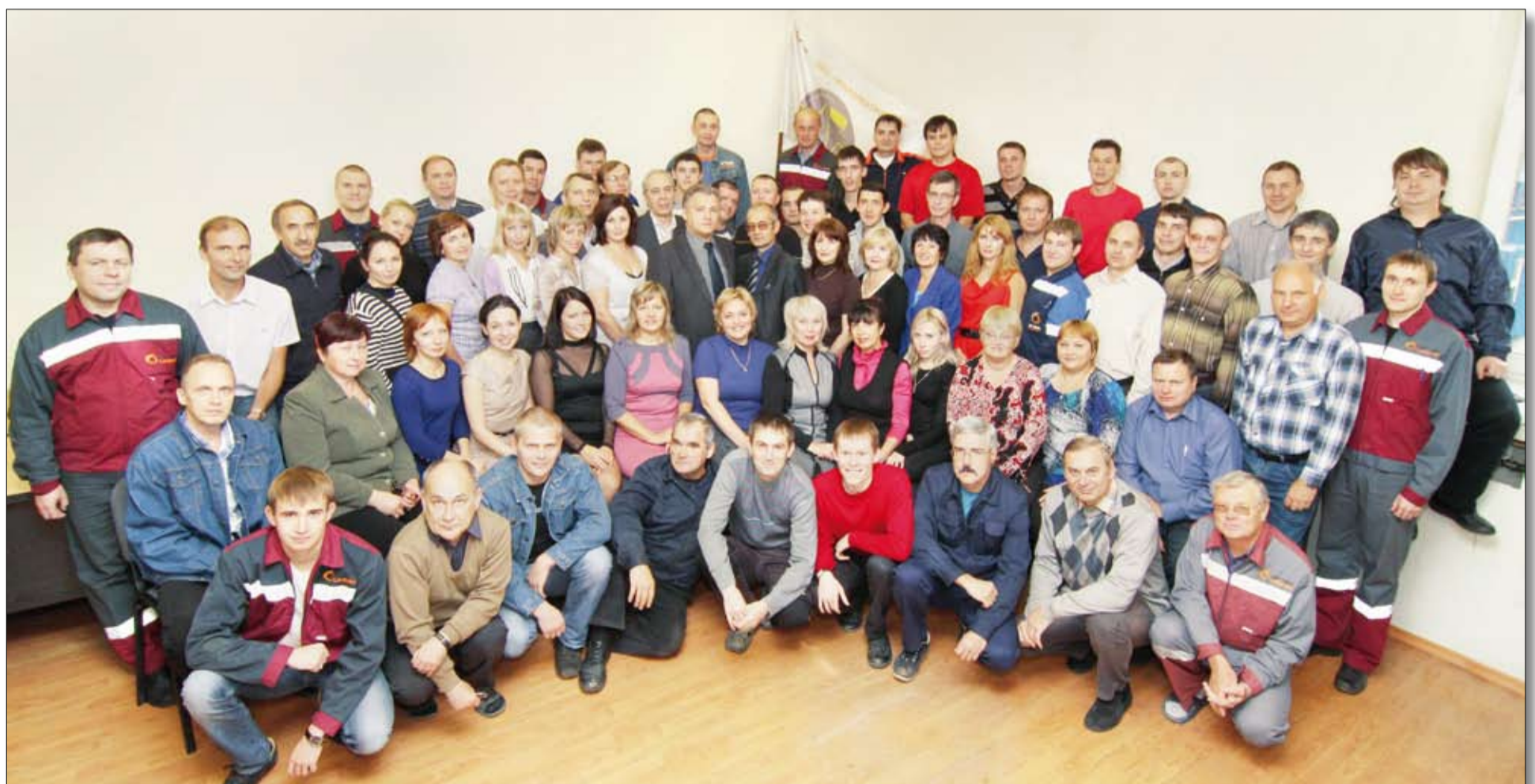
Коллектив управления автоматизации ОАО «Уралэлектромедь».