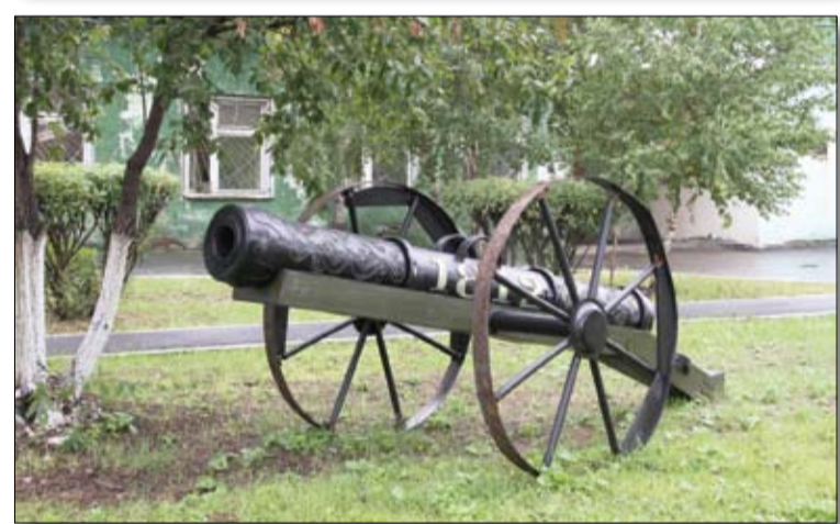
Издали буфаторскую пушку не отличить от настоящей.