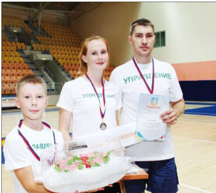
Ворожцовы заработали медали в честной борьбе!