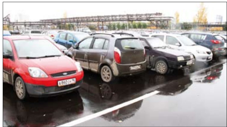
Парковка у КПП № 5 на Феофанова пользуется заслуженной популярностью у работников: и комфортно, и к работе близко.

Внимание: Администрация оставляет за собой право блокировать въезд на любую из указанных стоянок в определённый период для подготовки к общественно значимым мероприятиям, а также в целях повышения безопасности работников ОАО «Уралэлектромедь» и ООО «УГМК-Холдинг».