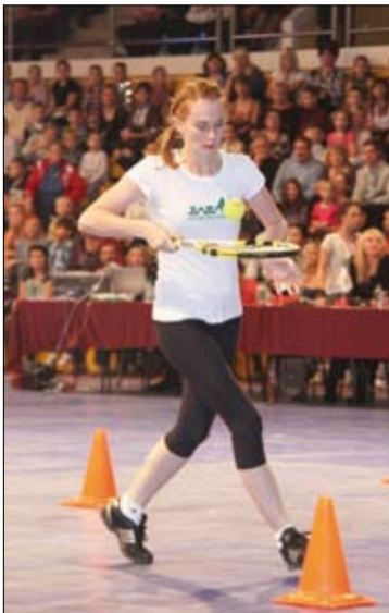
«Теннис – моя страсть!»