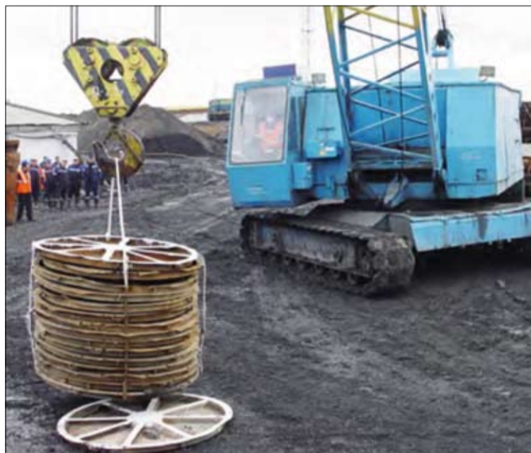
Машинисты кранов филиала «ППМ» устанавливают груз в центр круга с точностью до сантиметра.

без рук. И каждый из них — на особом счету. Но кто же самый-самый? Ответ на этот вопрос дал первый конкурс профмастерства «Лучший машинист крана стрелового гусеничного ДЭК-251».