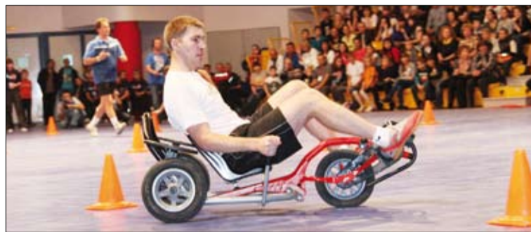
«Баланс-байк» требует спортивной формы и навыков.