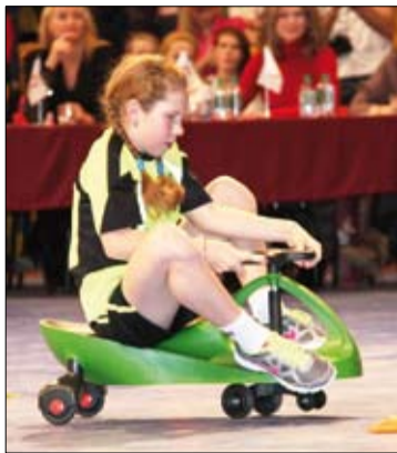
И как на этом ездить?