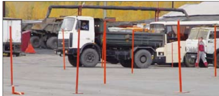
«Лес» стоек с интервалом восемь метров нужно преодолеть «змейкой» передним и задним ходом.