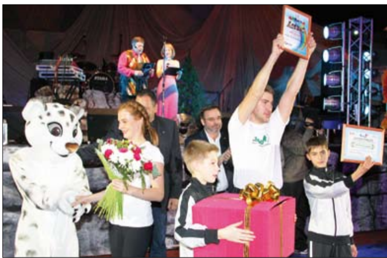
Ура, мы в тройке лидеров!