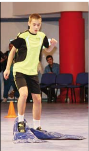
«Ну и придумаю! В лапах – по паркету!»

С ЕМЕЙНАЯ жизнь, как известно, не бывает лёгкой и гладкой. Но умение вместе преодолевать самые неожиданные препятствия – и есть главный секрет семейного счастья.